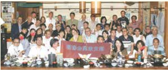
2022年の支部懇親会。直前にマスクを外して無言でニコリ。

本年ご卒業される皆様にご心よりお祝い申し上げます。また、朝陽会会員の皆様におかれましては、ますますご健勝のこととお慶び申し上げます。 朝陽会関東支部は2008年7月の第一回総会から同窓会活動を本格的に開始し今年で16年目を迎えます。昨年はコロナ禍の第6波7波の狭間のタイミングで3年振りに支部総会・懇親会を開催しました。以前の約半分46名での縮小開催でしたが、朝陽会ゆかりの企業(個人)から協賛頂いた品々を巡る抽選会&じゃんけん大会や、現役西高生の四校定期戦ニュース動画などおおいに盛り上がりました。最後はマスク着用で校歌を合唱です。西高の校歌は歌詞も音楽も雄大でホントに元気が出ます。宮崎弁の飛び交う空間に浸り、久々に絆・ネットワークを深めた皆の満足そうな笑顔をご覧ください。 本年の総会・懇親会は7月の第一土曜日、7月1日(土)の予定です。コロナ収束を睨みながら、以前の100名規模に戻し広めの会場での開催を計画しておりますので、GW以降に上記フェイスブックで確認下さい。先輩・後輩・同級生お誘い合わせの上奮ってご参加下さい。 関東支部の活動のコンセプトは、「同窓生同士の幅広い交流&人的ネットワークの拡大」です。堅苦しさや形式は存在しません！進学・就職・転勤等により関東圏に移られる皆様、出張でお越しの皆様、関東支部(上記メアド)や各理事に遠慮なくご連絡下さい。