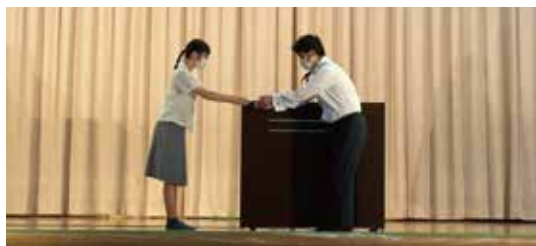
2022年9月14日(水)朝陽会文化の部1日目、体育館にて母校学習支援授与式が行われ、今年の寄贈品(冷水機2台)の目録を贈呈させていただきました。この記念品を受け取った生徒会長より在校生代表として丁寧なお礼の言葉を頂戴しました。

今年、宮崎西高の未来への補助線を、皆さまと一緒に描けること、心から感謝しています。