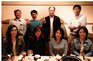
2019年11月のついでに会

朝陽会会員の皆様におかれましては、益々ご健勝、ご活躍のこととお慶び申し上げます。また、本年ご卒業される皆様に対しましては心よりお祝い申し上げます。 朝陽会本部・関東・福岡各支部におかれましては、平素より格別のご高配を賜り誠にありがとうございます。 朝陽会関西支部は2005年(平成17年)から活動を始め、今年で17年目を迎えます。毎年1回7月に総会・懇親会を開催している他に、毎年2回の理事会と理事会後の懇親会を開催して参りました。 昨年コロナ禍の中で総会は中止となりましたが、2022年1月にはZOOMを使って、初めてのオンラインでついでに開催しました。 今年は2年連続で中止となった第15回目の関西支部総会・懇親会を7月下旬に開催予定です。 さて関西地区では、皆様ご存知の通り、毎年各分野の競技大会が開催されています。在校生の皆様が全国大会に出場される際には是非ご連絡をお願いいたします。関西支部の有志にて大応援をさせていただきます。在校生の皆様様の活躍をこれからも期待しております。 これまで関西支部の行事に参加されたことのない関西地区在住の卒業生の皆様、転勤や出張等関西方面でお仕事をされる皆様も、是非、メールやフェイスブック公式ページでご連絡下さい。女子会がご希望の方にも対応しておりますので、ご連絡をお願いいたします。西高時代のいろいろな思い出、自分が今携わっているお仕事のことなど大いに語り合いませんか！ 連絡先と総会開催日程は上記になります。たくさん卒業生からのご連絡をお待ちしております！