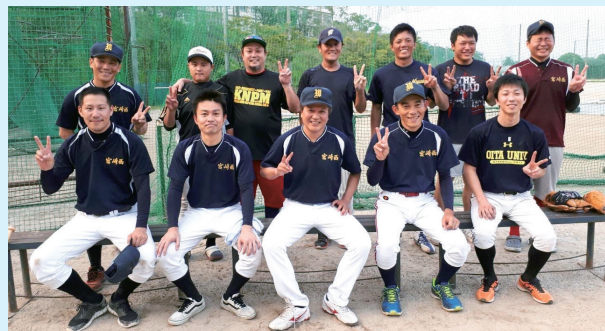
写真は2018年8月撮影のもの