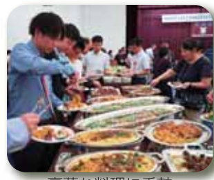
豪華な料理に舌鼓