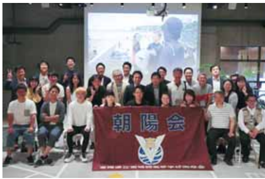
昨年の学年代表者会議