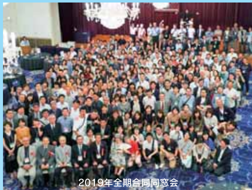
2019年全期合同同窓会