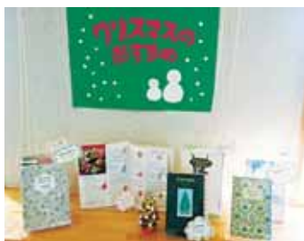
(写真) 図書室の季節毎の本の紹介・ディスプレイコーナーもお手伝いしました。

そして、夢ができれば、夢を叶えてください。サポートは、いろんなところからやってくる気がします。