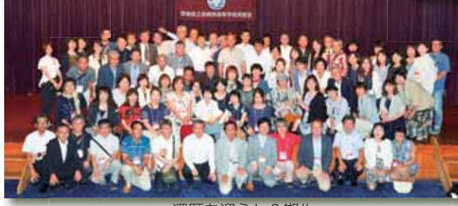
還暦を迎えた2期生