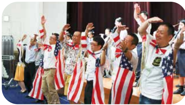
21期生によるヤングマン!

学生時代の私は、目立つこともなく平凡に過ごしていただけに今回の大役は、プレッシャーと共に不安でいっぱいでした。そんな中、一緒に幹事役員を引き受けてくれたメンバー。一緒に内容を考え、構想を練った