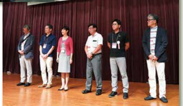
還暦を迎えられた1期生の皆様に、記念品をプレゼント。とっても若々しいステキな先輩ばかりです♪