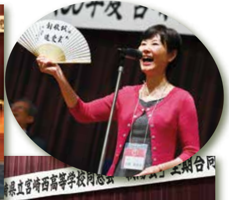
宮崎西高等学校同窓会 第25回全期合同同窓会